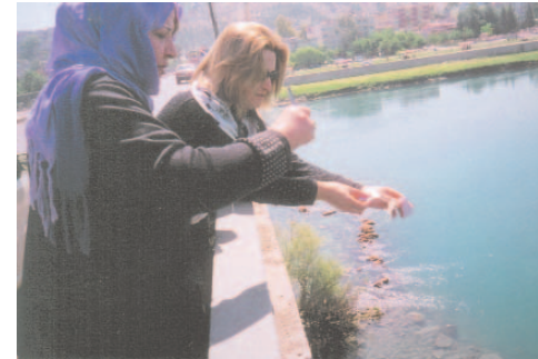
Fotoğraf 65: Dilek Kağıtlarını Fırat Nehrine Atan Kadınlar (Hidrellez/Şanlıurfa)