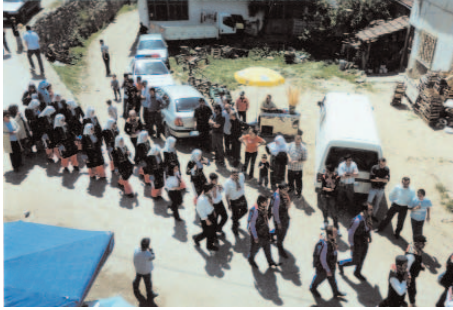
Fotoğraf 45: Şenlik Meydanına Yüreyin Bir Grup (Hidrellez/Bilecik)