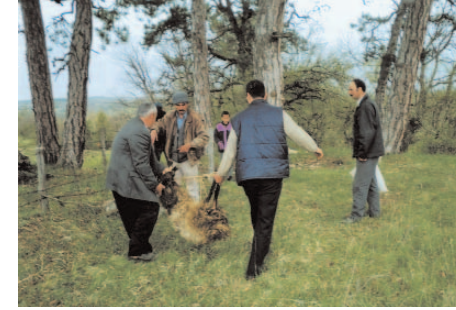
Fotoğraf 48: Adağın Türbe Etrafında Döndürülmesi (Hidrellez/Karabük)