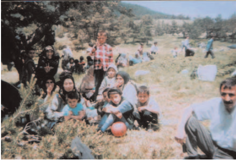
Fotoğraf 85: Eğlenceden Bir Kesit (Emekli Şenlikleri / Ankara- Kızılcahamam)