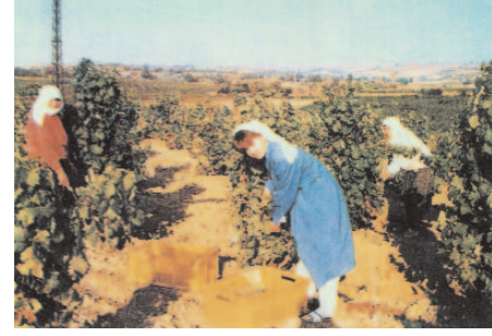
Fotoğraf 105: Şaraplık Üzümlerin Hasat Edilmesi (Bağbozumu Şenliği/Yozgat)