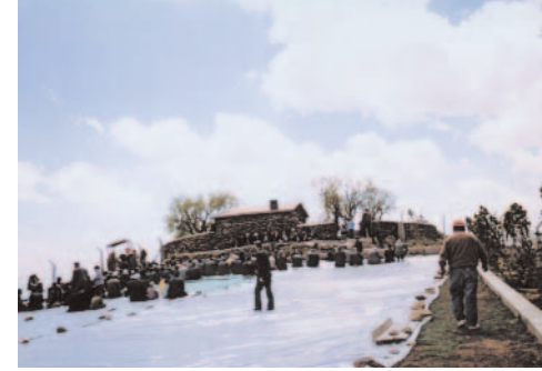
Fotoğraf 23: Topluca Yapılan İbadet (Düt Dede Şenlikleri / Ankara)