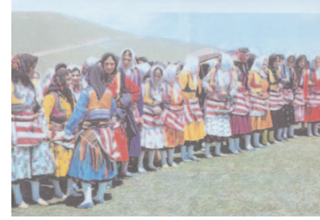
Fotoğraf 99: Yüresel Kıyafetleri İle Gençler (Yayla Ortası Şenlikleri/Trabzon)