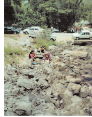
Fotoğraf 41: Derede Bulaşık Yıkayan Kadınlar (Hidrellez/Antalya-Kumluca)