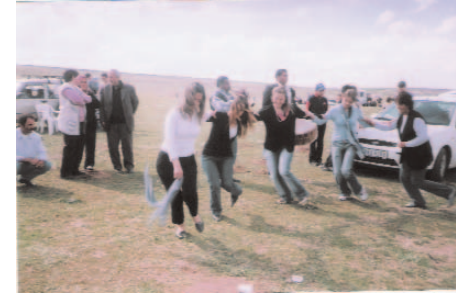
Fotoğraf 54: Halay Çeken Gençler (Hidrellez/ Kırşehir-Değirmenözü)