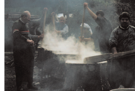
Fotoğraf 113: Namaz Çorbası Karıştıran Erkekler (Gadir Bayramı/Ankara)