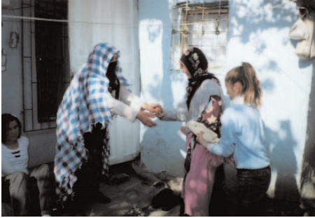
Fotoğraf 80: Ev Ev Geziliş Yiyecek Toplanırken (Dodo Gezme/Bayburt)