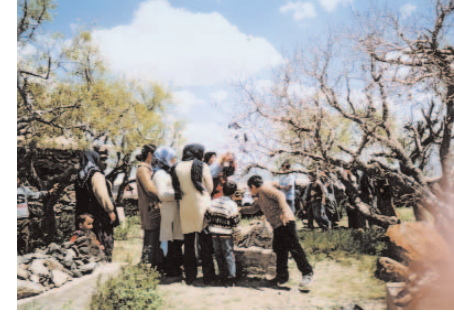
Fotoğraf 24: Dilek Ağacına Bez Bağlayan Kadınlar (Düt Dede Şenlikleri / Ankara)