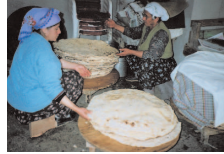
Fotoğraf 112: Tandır Ekmeği Yapan Kadınlar (Gadir Bayramı/Ankara)