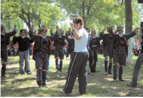
Fotoğraf 44: Halk Oyunları Ekibi (Hidrellez/Balıkesir- Zeytinli Köyü)