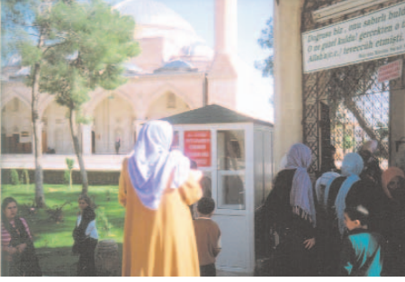
Fotoğraf 66: Hz. Eyyub'un Türbesini Ziyaret Eden Kadınlar (Hidrellez / Şanlıurfa)