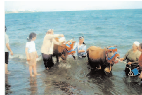
Fotoğraf 71: Yıkayarak Kötülüklerden Arındırılan Hayvanlar (Hidrellez/Trabzon-Şalpaazarı)