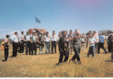
Fotoğraf 102: Gelin Alayının Alana Girişi (Yörük Şöleni/Eskişehir)