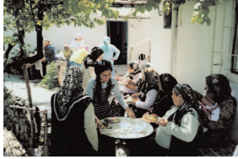
Fotoğraf 38: Hazırlanan Yiyeceklerin Misafirlere İkramı (Hidrellez/Ankara-Bâlâ)