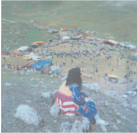
Fotoğraf 98: Şenlikten Bir Kesit (Yayla Ortası Şenlikleri/Trabzon)