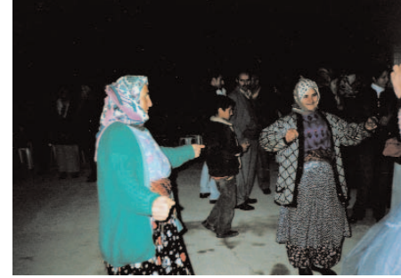
Fotoğraf 94: Tef Eşliğinde Oynananlar (Göğrüz Otu Şenliği/Antalya)