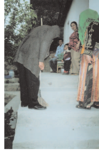
Fotoğraf 4: Ev Ev Dolaşılıp Hububat Alınırken (Saya Gezme / Sivas)