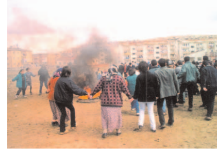
Fotoğraf 17: Nevruz Ateşi Çevresinde Halay Çekener (Sultan Nevruz / Sivas)