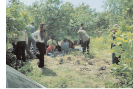
Fotoğraf 18: Bağ ve Bahçelerinde Nevruz Kutlayanlar (Sultan-ı Nevruz / Gaziantep)