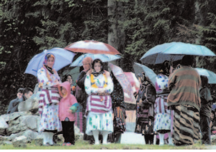
Fotoğraf 72: Yöresel Kıyafetli Kızlar (Hidrellez/ Trabzon-Şalpazarı)