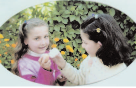
Fotoğraf 19: Yumurta Yarışı (Yumurta Bayramı Şahr-ıl Bayf / Siirt)