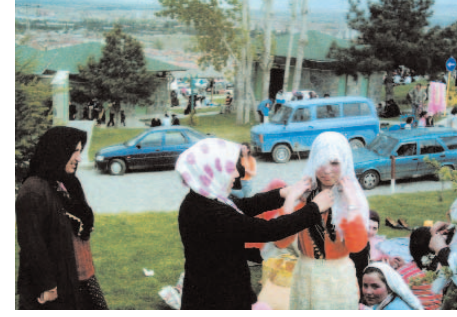
Fotoğraf 28: Geline Hediye Edilen Namaz Yaşmağı (Hidrellez/Afyon)