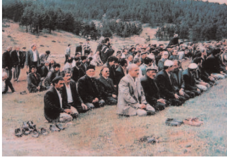
Fotoğraf 84: Yağmur Duası (Emekli Şenlikleri / Ankara- Kızılcahamam)