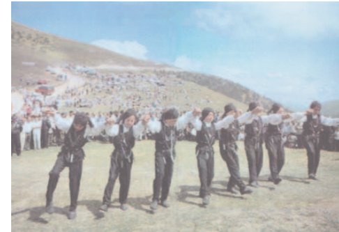
Fotoğraf 101: Horondan Bir Kesit (Yayla Ortası Şenlikleri/Trabzon)