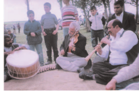
Fotoğraf 53: Kutlamadan Bir Kesit (Hidrellez/Kırşehir- Değirmenözü)