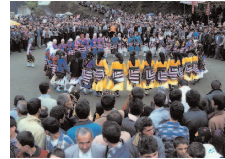
Fotoğraf 68: Yöresel Kıyafetleri İle Horon Tepen Kızlar (Hidrellez/Trabzon-Şalpaazarı)