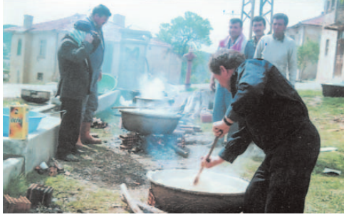
Fotoğraf 114: Büyük Kazanlarda Pişirilen Pilav (Hacet Bayramı/Ankara)