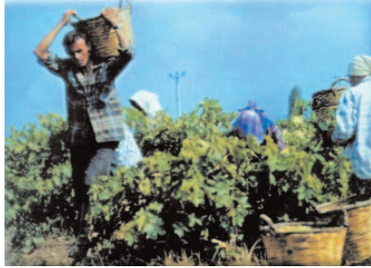
Fotoğraf 104: Heyelere Doldurulan Üzümler (Bağ Bozumu Şenlikleri/Çankırı)